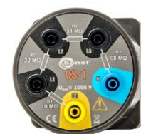
CS-1 - Simulador de cable WAADACS1