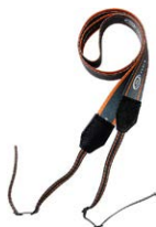
Arnés para el medidor (tipo M1)