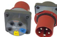
Adaptador AGT-63P para enchufe trifásico 63 A con neutro WAADAAGT63P