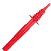
Sonda roja de punta 1 kV (toma tipo banana)