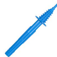
Sonda azul de punta 1 kV (toma tipo banana) WASONBU0GB1